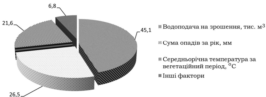
Рис.3. Структура частки впливу факторів на формування режиму рівнів ґрунтових вод Каховського зрошувального масиву

Дисперсійним аналізом результатів досліджень встановлено, що на формування РГВ в умовах Каховського зрошувального масиву максимально впливає водоподача на зрошення (дольова участь фактора – 45,1%) та сума опадів (26,5%). Середньорічна температура повітря має обернений зв'язок з формуванням РГВ (дольова участь фактора – 21,6%) (рис. 3).