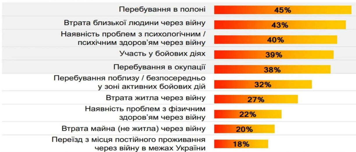
Рис 2. Проблеми українців

Працівники повинні подбати про матеріальні та нематеріальні стимули, які мотивуватимуть працівників, включаючи: лікарняні, премії, оздоровчі програми, безкоштовні обіди, збільшення обідньої перерви, додаткові вихідні або підвищення процентної ставки за зміни у вихідні та свята, можливість оформити на робочому місці спальні місця для тих, хто втратив будинок або чий будинок перебуває занадто далеко [3]. Крім цього, буде корисно проводити загальні збори, заради підкріплення відносин у колективі, спілкування та обговорення проблем роботи. Таким чином, психологічний стан покращиться, а колектив стане більш дружним.