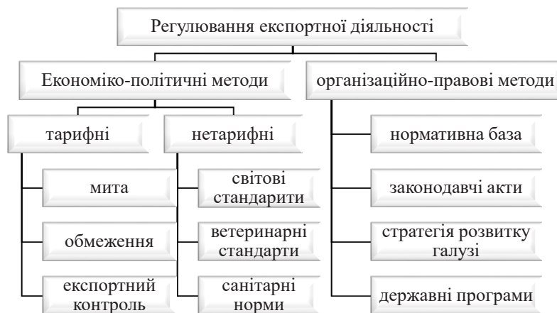
Рис. 2. Методи регулювання експортної діяльності