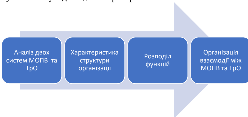
Рис. 2. Структурний підхід щодо розвитку потенціалу підрозділів територіальної оборони.

Структурний підхід щодо розвитку потенціалу сил територіальної оборони полягає в організації та побудові сил територіальної оборони відповідно до конкретної структури, яка враховує географічні, соціокультурні, економічні та інші особливості території. Цей підхід передбачає створення і підтримку локальних, регіональних та національних сил, які забезпечують оборону та безпеку відповідних територій.