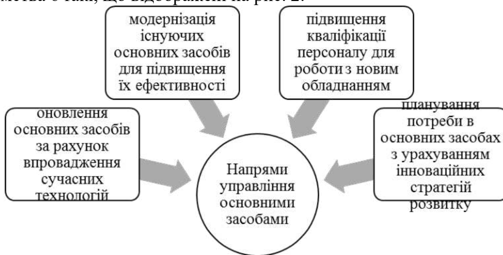
Рисунок 2. Напрями управління основними засобами для формування інноваційного підприємства

Сучасні умови функціонування підприємств дозволяють запроваджувати інноваційні рішення для отримання конкурентних переваг. Основними напрямками управління основними засобами для формування інноваційного підприємства є такі, що відображені на рис. 2.