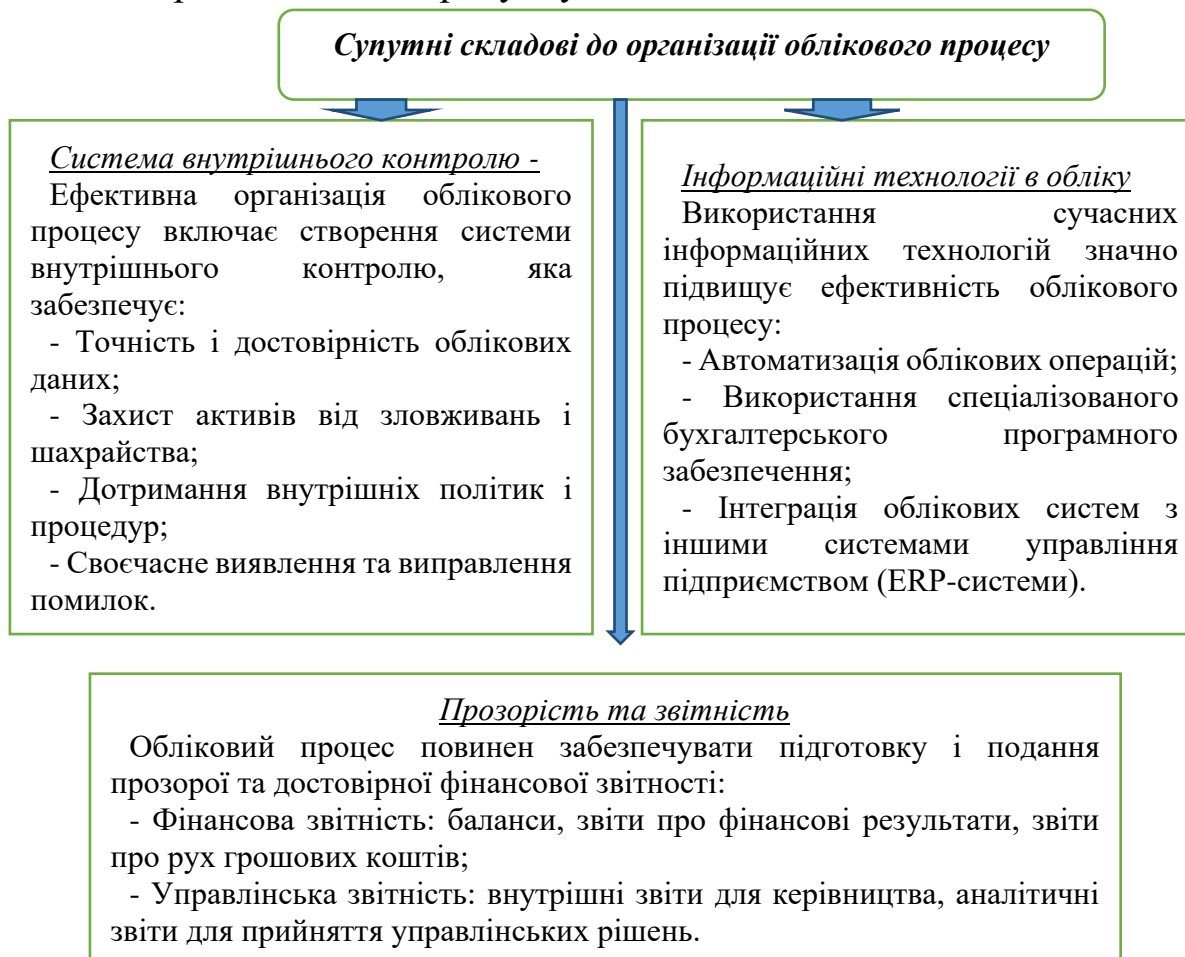
Рисунок 1 - Узагальнена схема супутніх складових організації облікового процесу

Оцінюючи думки авторів стосовно організації облікового процесу в Україні, доцільно звернути увагу, що даний процес включає супутні складові, які виступають додатковими елементами його ефективного функціонування. Розроблена схема супутніх обліковому процесу складових представлена на рисунку 1.