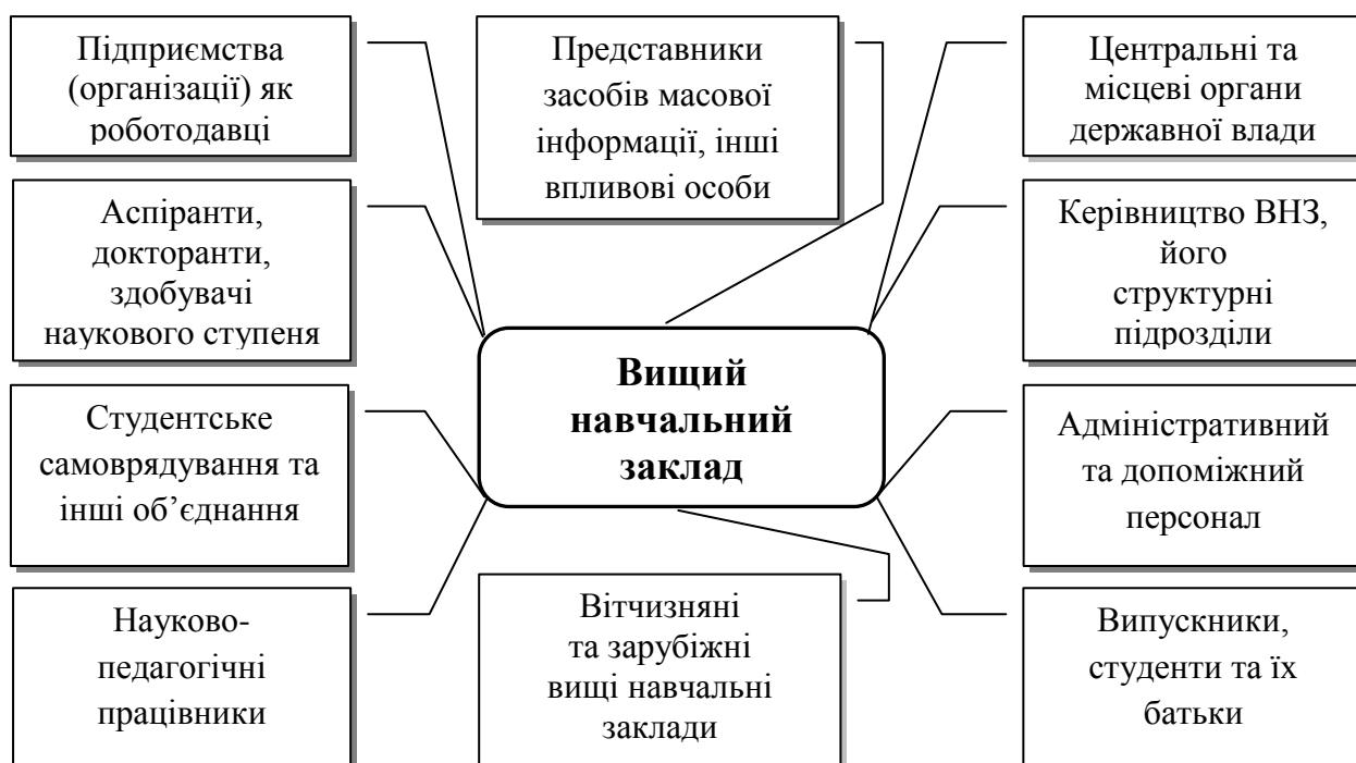
Рисунок 1. Категорії стейкхолдерів, з якими взаємодіє вищий навчальний заклад