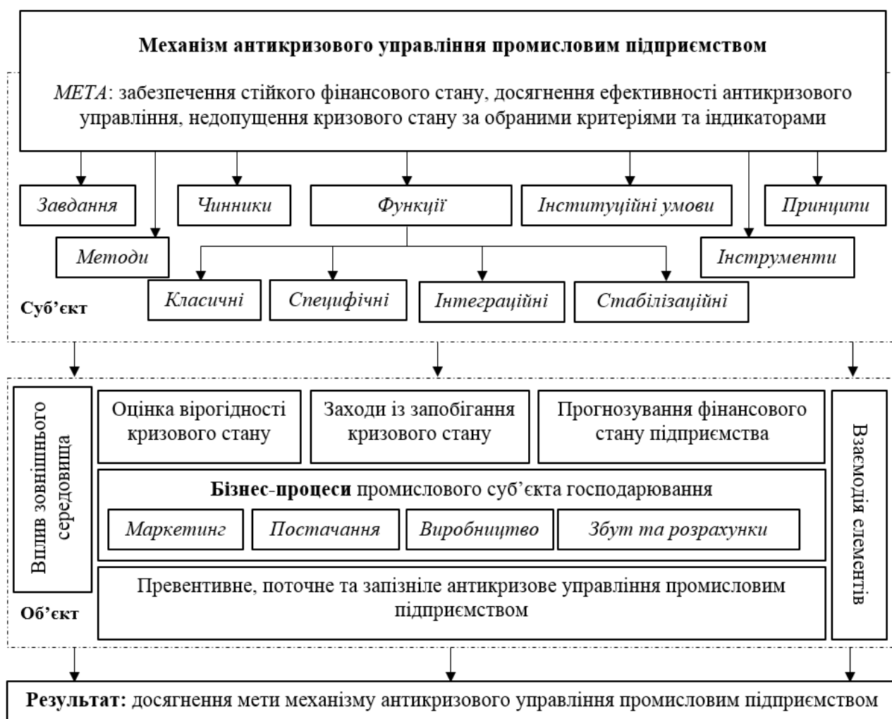
Рисунок 2 – Механізм антикризового управління промисловим підприємством