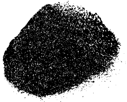
Рис. 1. Порошкоподібний матеріал

Сучасний етап розвитку машинобудування використовує різноманітний перелік матеріалів для виготовлення деталей машин і приладів, не винятком є і порошкоподібні матеріали з вуглецевої, легованої і стійкої до корозії сталі, бронзи, латуні, міді та інших металів або сплавів (рис. 1).