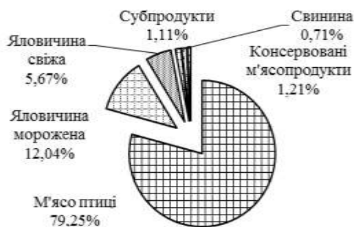
Рисунок 2 – Товарна структура експорту м'ясопродукції, січень - серпень 2018 рр., %

Так, у січні-серпні 2018 р. експорт м'яса птиці у товарній структурі вітчизняної м'ясопродукції (рис. 2) становив 79,25% від загального виторгу, яловичини мороженої – 12,04%, яловичини свіжої – 5,67%, консервованих м'ясопродуктів – 1,21%, субпродуктів – 1,11%, свинини – 0,71% [2].