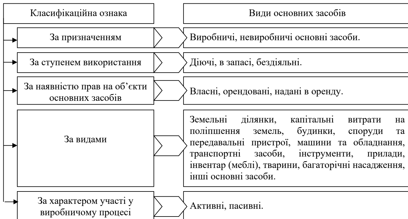
Рисунок 2 – Класифікація основних засобів на підприємстві

тим повільніше він зношується, тим довше передає свою вартість продукції, яку виробляє. До однієї класифікаційної групи з метою зручності нарахування амортизації відносять основні засоби, які мають однаковий строк та інтенсивність експлуатації (рис. 2) [6, с.316].