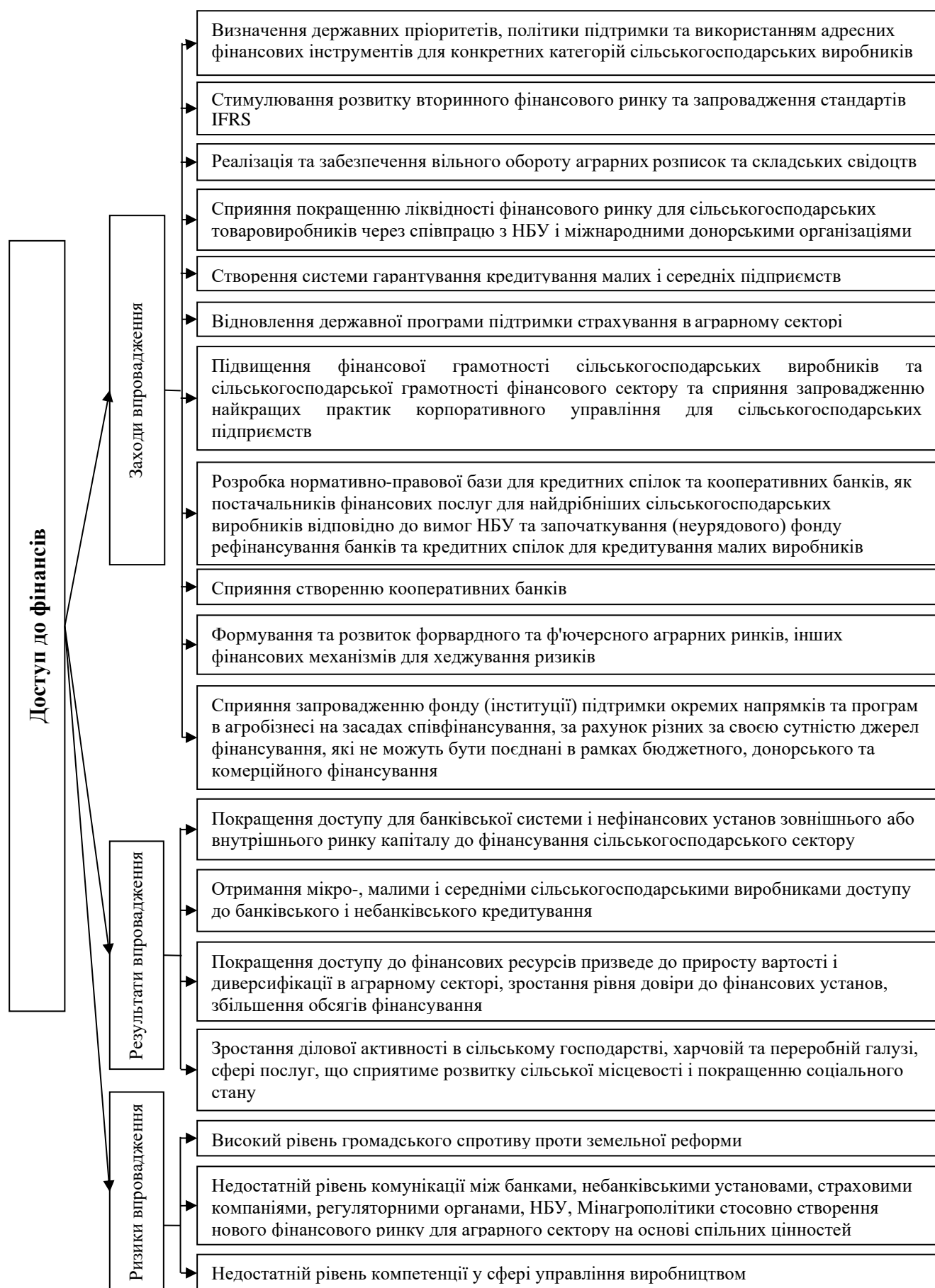
Рисунок 2 – Заходи, результати та ризики впровадження доступу до фінансів