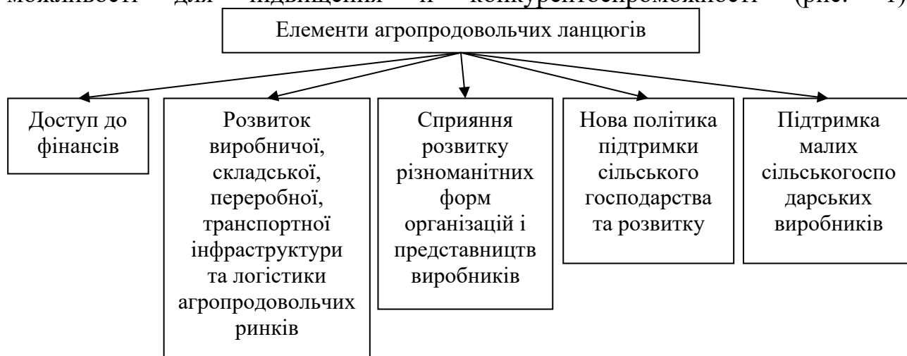
Рисунок 1 – Елементи агропродовольчих ланцюгів, які підвищують конкурентоспроможність аграрного сектору України

чергу потребують розвинутих сільськогосподарських фінансових ринків, сприятливого ділового середовища і державної політики. Детально розглянемо елементи агропродовольчих ланцюгів, досліджуючи з різних позицій можливості для підвищення її конкурентоспроможності (рис. 1).