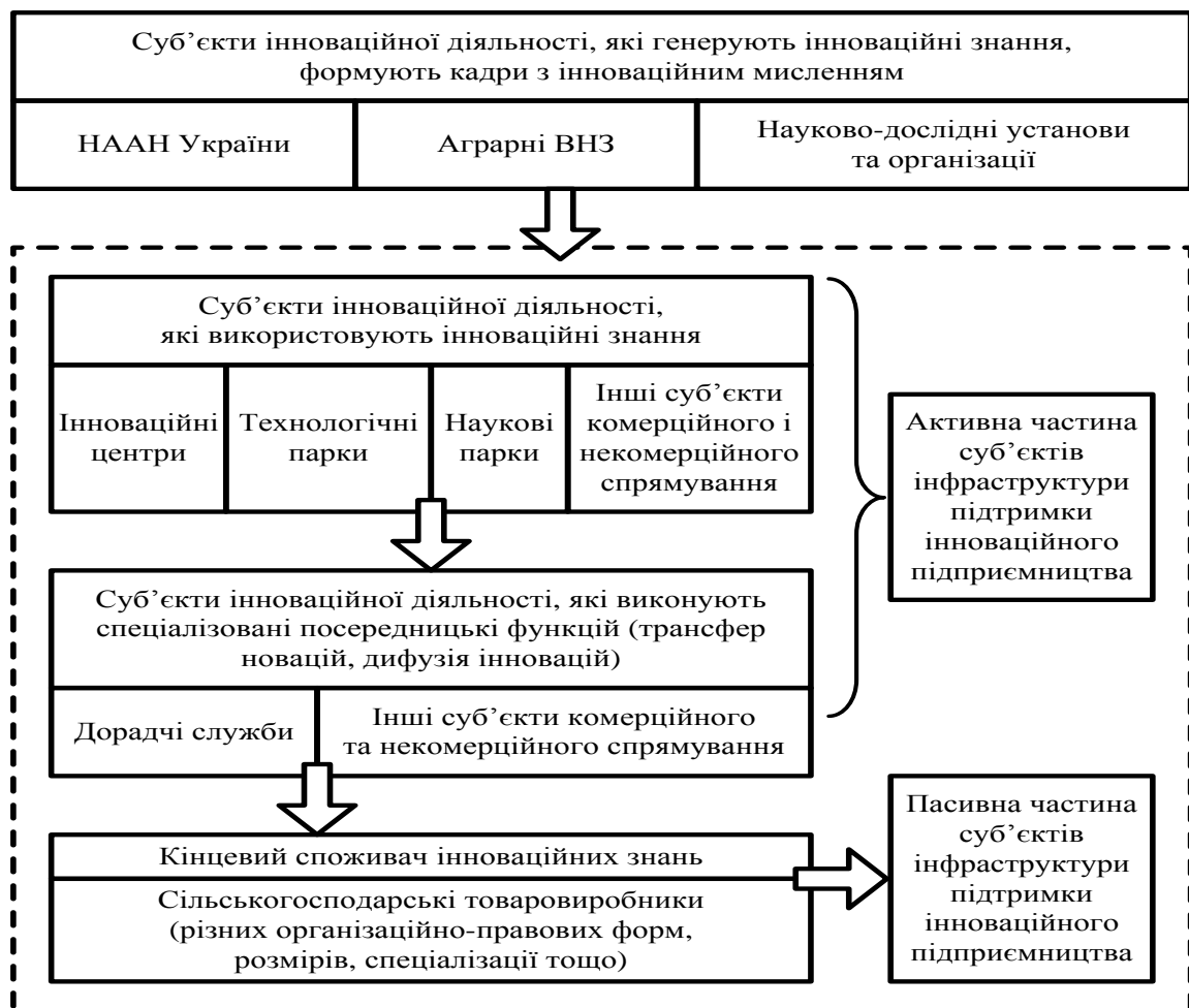
Рис. 1. Суб'єкти інфраструктури підтримки інноваційного підприємництва в аграрному секторі економіки

інноваційні бізнес-інкубатори; інноваційні центри; консультаційні центри; навчально-науково-виробничі комплекси (центри, дільниці); наукові й навчальні центри; наукові парки; науково-впроваджувальні підприємства; небанківські фінансово-кредитні установи; технологічні парки; центри інновацій та трансферу технологій; центри комерціалізації інтелектуальної власності та ін. Проте діяльність більшості з них на сьогодні є фрагментарною, при цьому залишається диспропорція у формуванні інфраструктури підтримки інноваційного підприємництва на галузевому й регіональному рівнях.