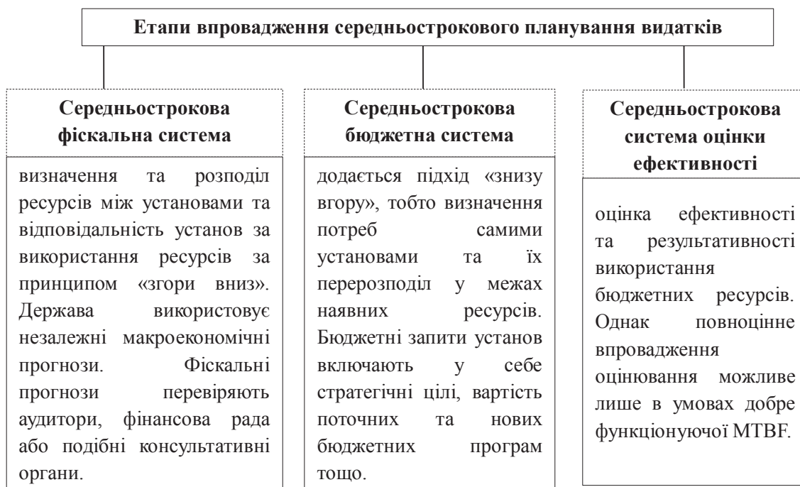
Рис. 2. Етапи впровадження середньострокового планування видатків