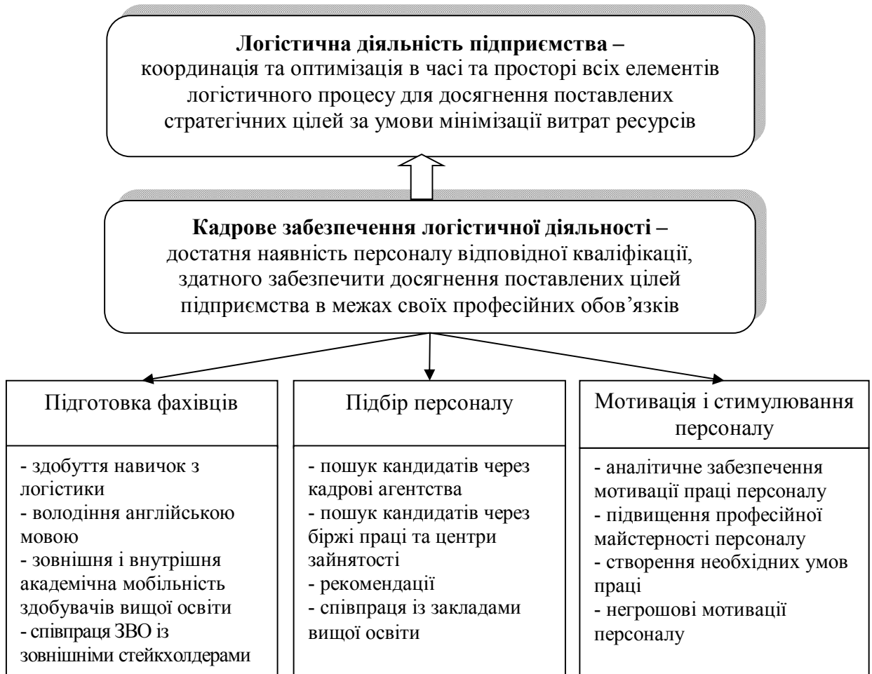
Рисунок 2 – Складові кадрового забезпечення логістичної діяльності

Беззаперечним є той факт, що рушійною силою розвитку і ефективного господарювання підприємств є його трудові ресурси. Активізація людського фактору є одним із стратегічних напрямів підприємства. У зв'язку із зазначеним доцільно визначити складові кадрового забезпечення логістичної діяльності підприємства (рис. 2).