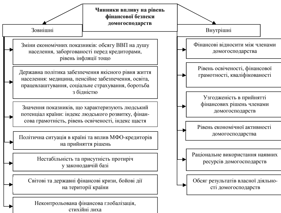
Рис. 2. Основні чинники впливу на рівень фінансової безпеки домогосподарств

Побудовано авторами на основі джерела [0].