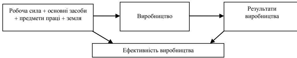
Рис. 1. Формування ефективності виробництва

тва можуть одержувати далеко не однакові за величиною результати. В такому випадку кажуть, що підприємства ведуть виробництво з різною ефективністю (рис. 1).