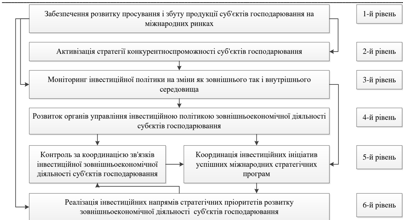
Рисунок 2 – Ієрархія зв'язку вибору напрямів стратегічних пріоритетів розвитку для залучення зовнішньоекономічних джерел фінансування суб'єктів господарювання